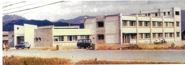
開院当時(開院の1966年12月)